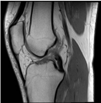
MRI: voorste kruisband intact

Tijdens het sporten of het maken van een verkeerde draaibeweging kan de voorste kruisband scheuren. U zakt door uw knie of verdraait uw knie. Vaak wordt een knappend gevoel in de knie ervaren. Zwelt u knie direct erna erg op, dan is er een kans dat uw voorste kruisband gedeeltelijk of volledig gescheurd is. De klachten variëren: vrijwel geen klachten, een instabiel gevoel ervaren of door uw knie zakken. Pijn heeft vaak een andere oorzaak dan een gedeeltelijk of volledig gescheurde voorste kruisband. Meestal is een ander letsel de veroorzaker van pijn, zoals kraakbeenschade, een gescheurde meniscus of een botkneuzing. Om er zeker van te zijn dat uw voorste kruisband gescheurd is, gaat de orthopedisch chirurg uw klachten na, wordt er een lichamelijk onderzoek van de knie gedaan, een röntgenfoto gemaakt en eventueel een MRI-scan aangevraagd. Soms is een kijkoperatie nodig om de diagnose te bevestigen.