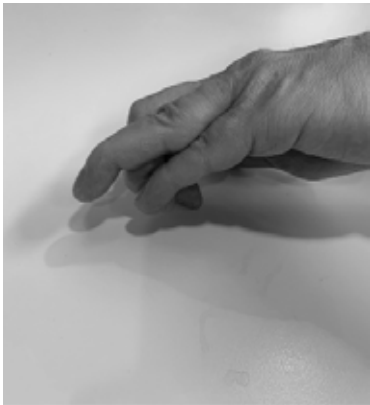
Gebogen stand vingertop (malletvinger)

Een malletvinger is een aandoening van een deel van de strekpees van de vinger. Hierbij gaat het topje van uw vinger hangen, zoals in onderstaande afbeelding. U kunt door de aandoening de top van uw vinger niet meer strekken.