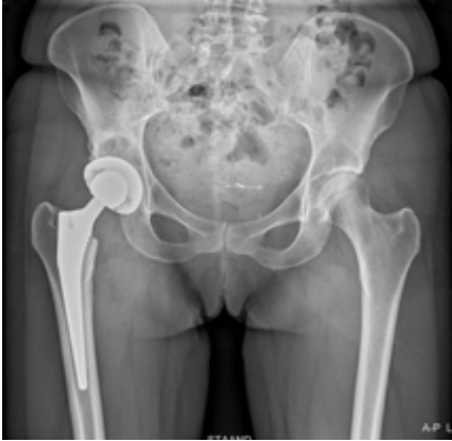
Illustratie 3: Röntgenfoto van de geplaatste totale heupprothese.

Bij een gecementeerde heupprothese wordt in het bekken ruimte gemaakt voor een kunststof kom. De versleten heupkop wordt vervangen door een keramische kop. De steel van deze kop wordt in het bovenbeen geplaatst. De steel én de kom worden met cement vastgezet.