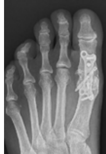
Vastzetten teen met schroeven of plaat met schroeven