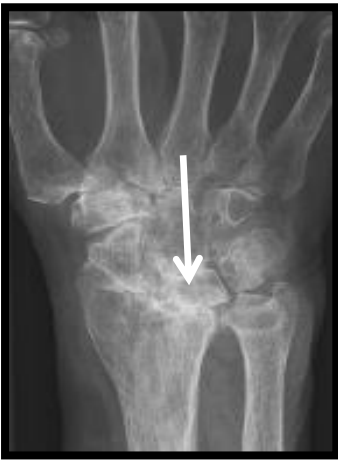
Figuur 2: röntgenfoto van een polsgewricht dat is aangedaan door reuma. De langdurige ontsteking heeft geleid tot slijtage van het polsgewricht. Er is geen gewrichtsspleet meer tussen de handwortelbeentjes omdat het kraakbeen is verdwenen (zie pijl).

Er zijn verschillende aandoeningen die slijtage van het polsgewricht kunnen veroorzaken. Denk hierbij aan reuma of een botbreuk. Bij reuma kan er een ontsteking ontstaan van het polsgewricht. Door zo'n gewrichtsontsteking, ook wel artritis genoemd, is de pols gezwollen, pijnlijk en stijf. Als een ontsteking lang duurt, kan dit ook nog leiden tot aantasting van het kraakbeen en de ligamenten. Er ontstaat slijtage (zie figuur 2). Ook kan er slijtage van het polsgewricht optreden door een ernstige breuk van het polsgewricht of door een verscheuring van de ligamenten van de pols. Dit treedt meestal pas vele jaren na het ongeval op. Net als bij een artritis is bij slijtage van de pols het gewricht gezwollen, pijnlijk en stijf. De slijtage op zich kan ook weer aanleiding geven tot een ontsteking van het gewricht met toename van de klachten.