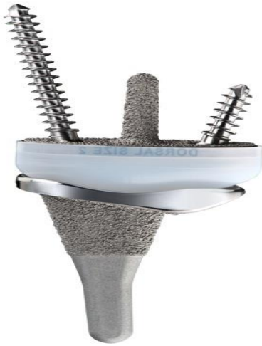
Figuur 3: de Freedom® polsprothese.